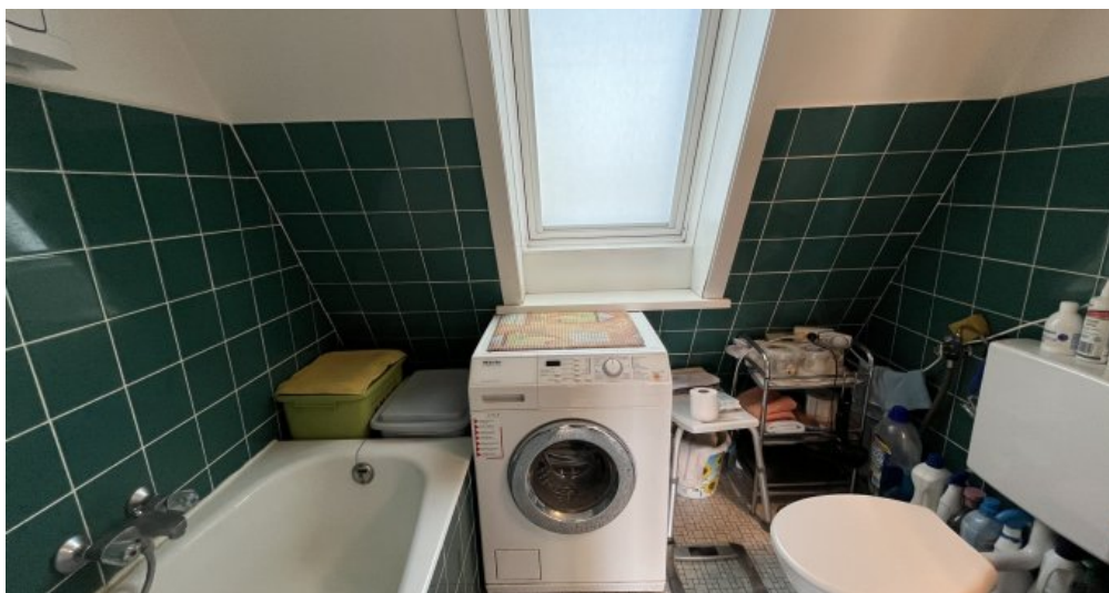
Vollbad mit Fenster